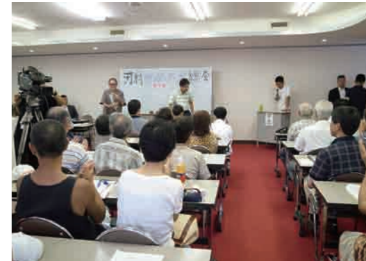
衆議院会館第1裏にて