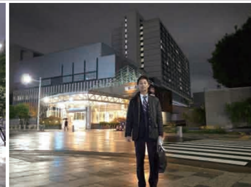
衆議院会館第1裏にて

すが、十分の施設だったように行革により予算配分して補い合うという発想は残念ながらないのかもしれない。