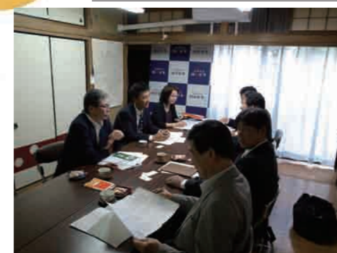
市議のみなさんと