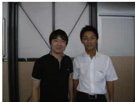
橋下府知事(当時)と署名活動の応援に来て下さった時の一枚。この日運転手をしていました。