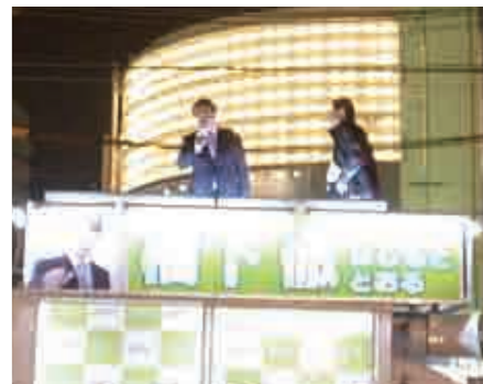
大村知事、河村市長の演説