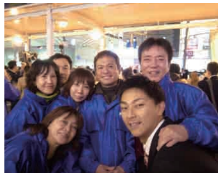
ナゴヤ市議団の皆さんと