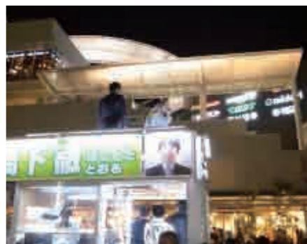
橋下大阪市長候補の演説

投票日を迎えると投票率が大阪市長選が60.92%で前回は17.31ポイント上回り、大阪府知事選は52.88%で前回は3.93ポイント上回り、という結果で完全勝利。本当におめでとうございます。そしてスタッフの皆様本当にお疲れ様でした。