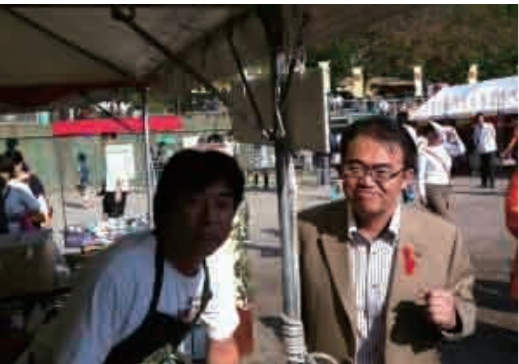
支援者の方と大村知事