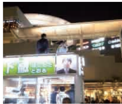
橋下大阪市長候補の演説