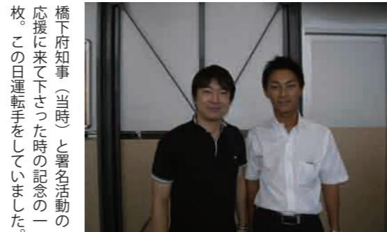
橋下府知事(当時)と署名活動の応援に来て下さった時の記念の一枚。この日運転手をしていました。