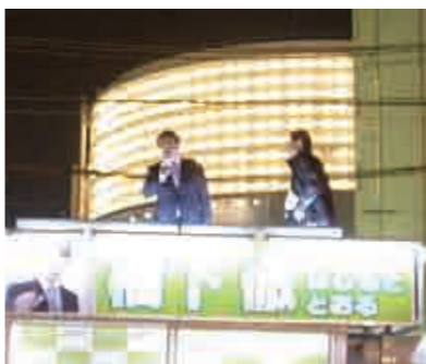
大村知事、河村市長の演説