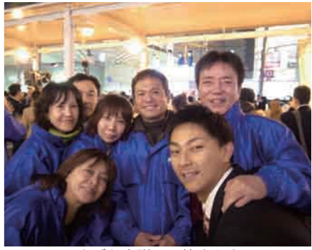
ナゴヤ市議団の皆さんと